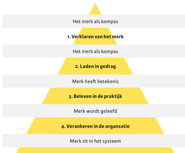
Figuur 1. Fasen van internal branding (Willems & Eck, 2008).

De programmamanager werd door het management gevraagd ervoor te zorgen dat de strategische keuze ook intern omarmd zou worden. De vraagstelling: 'Hoe krijgen we Voeding Sport Bewegen tussen de oren van de medewerkers?', werd aanvankelijk benaderd vanuit het marketingdenken. Geadviseerd werd een proces van 'internal branding' (zie figuur 1) op te starten, om de internalisering van de strategische keuze te realiseren.