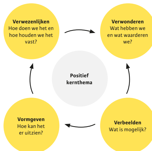
Figuur 2. Cirkel van waarderende benadering (gebaseerd op Tjepkema, Verheijen & Kabalt, 2016).

Analoog aan deze methode en ervaringen wilden de adviseurs sessies van vier uur organiseren en daarin de cirkel van de waarderende benadering (zie figuur 2) eenmaal doorlopen.